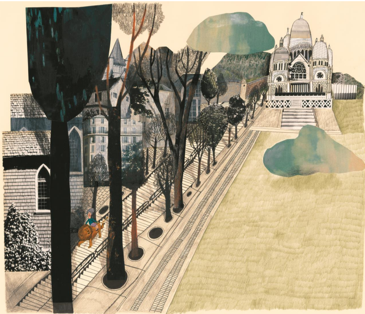
圖：碧翠絲・阿雷馬娜，《巴黎的獅子（中法文版）》，米奇巴克出版