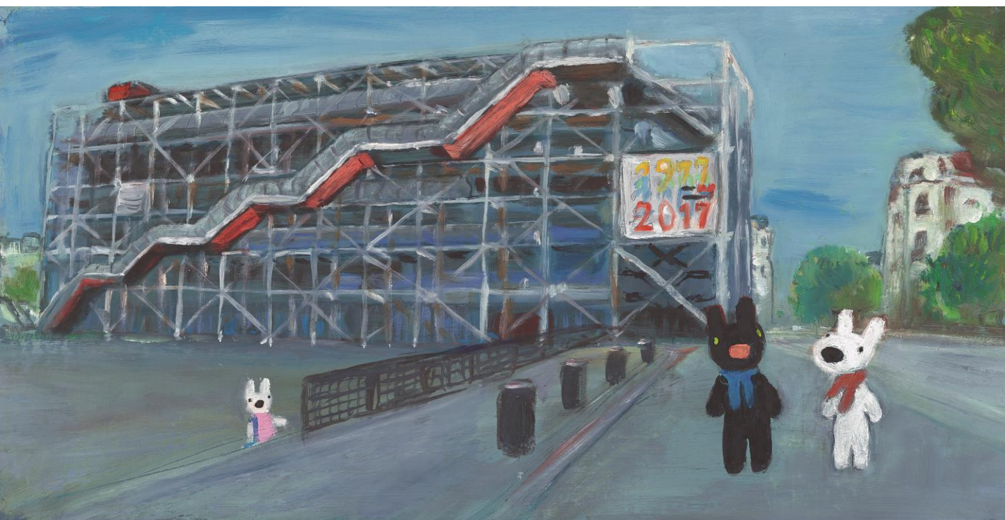
圖：安·居曼，《麗莎和卡斯柏：當你一輩子的好朋友套書》，步步出版